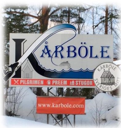
Infartsskylt till Kårböle.