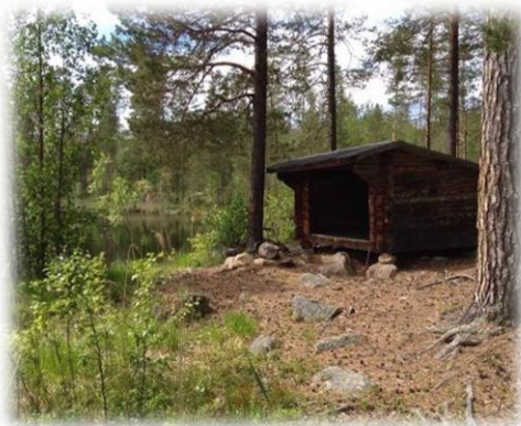
Gapskjulet vid Flarkenområdet.

Utveckla friluftsliv och vildmarksliv, t ex vandrings- och skoterleder, stigar, skidspår, fiske och fågelskådning