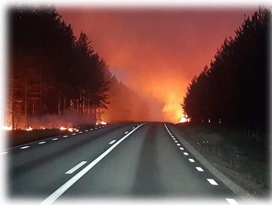
Riksväg 84, Ängra-trakten, där elden gick över vägen.

Kårböle blev rikskänt sommaren 2018 på grund av de kraftiga skogsbränderna i Hälsingland vilka drabbade omgivningen till denna by.