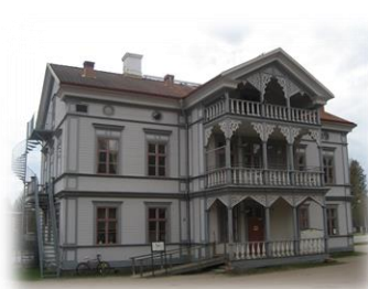
Vårdshuset Pilgrimen

Kårböle lockar även med ett rikt vildmarksliv med björn, varg, lo, järv, älg och rådjur i de vackra bärrika skogarna, med utter, bäver och ädelfisk i våra sjöar och vattendrag och med fåglar som örnen, trana, orre, tjäder, gås, svan och småfåglar i den friska luften.