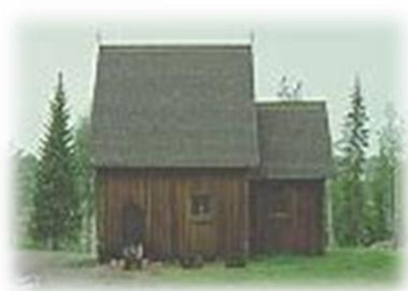
Kårböle Stavkyrka

Kårböle är en småort och kyrkby i Kårböle/ Färila församling i Ljusdals kommun, Hälsingland. Kårböle ligger exakt mitt i Sverige vid Ljusnan. Vid östra infarten ligger Kårböle Skans. Skansen fick sin slutliga utformning 1644 i samband med Torstensons krig 1643-1645. Huvudstrukturen är i stort sett intakt, men allt trävirke ovan jord är borta. Skyddsvallarna har sjunkit något. Vallgravarna är numera vattenfyllda sedan Ljusnan dämts vid Laforsen.