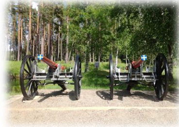
Kanonerna vid Skansen

Till Kårbölebygden räknas Kårböle samt de mindre byarna Karlstrand, Kårböleskog och Ängra.