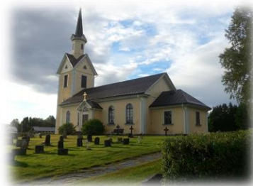
Kårböle kyrka

Många tar paus och äter, andra stannar och aktiverar sig med fiske, kanoting eller vandringar. Kårböle bjuder också sina besökare på en rad sevärdheter där Kårböle stavkyrka, Kårböle Skans, Sveriges Mitt, Öjeforsens kraftverk, Ängra vildmarkscamp, Vårdshuset Pilgrimen, Smedjan och Kvarnen endast är några.