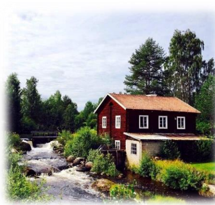
Kårböle bysmedja.