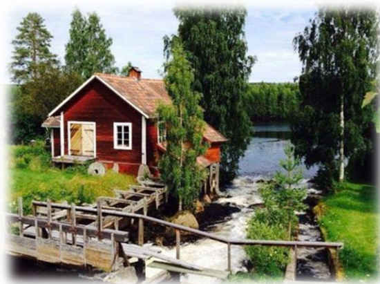
Den bevarade Bykvarnen.